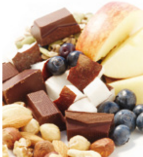
JEANETTES IDEALE DAGMENU