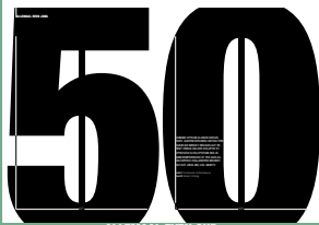
ALLEMAAL EVEN OUD