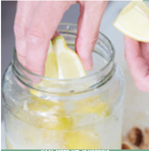
HAAL MEER UIT JE VOEDING