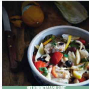
HET MEDITERRAAN DIEET